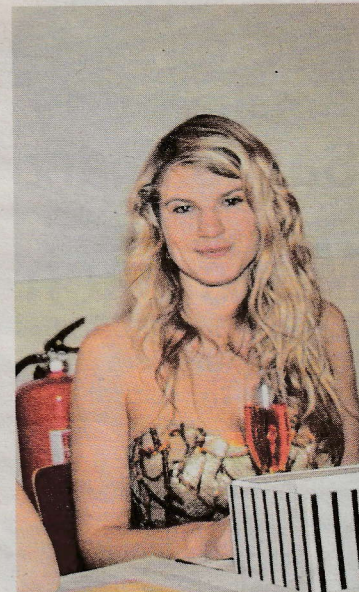
Ohne Uniform aber um so charmanter, die Dame an der Kassa.