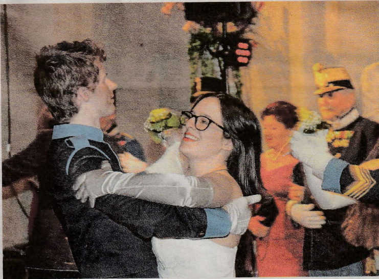
Für die musikalische Unterhaltung und eine immer volle Tanzfläche sorgte das Tanzorchester der Militärmusik.