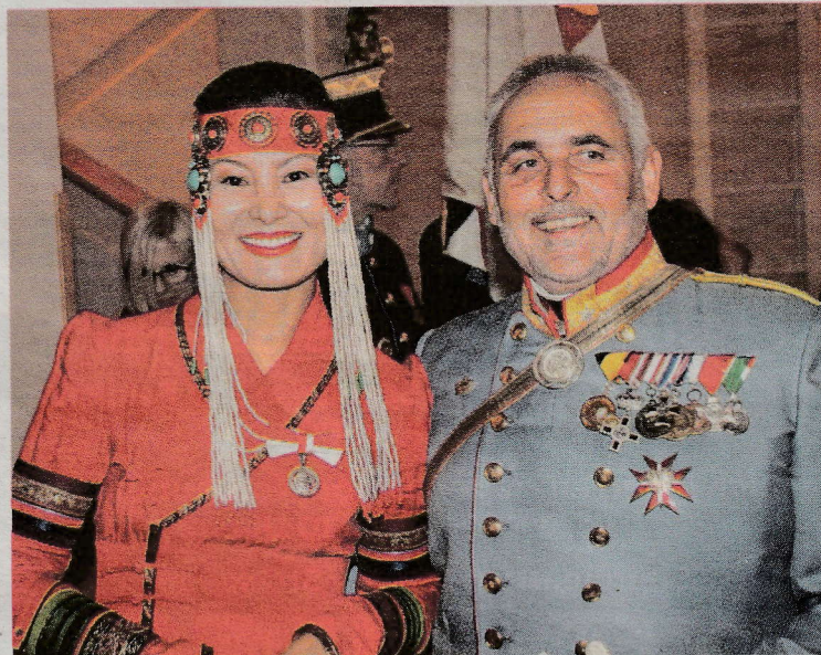
Aus Oberösterreich angereist, ehemaliger Heeres-Hubschrauberpilot mit seiner Gattin im traditionellen mongolischen Hochzeitskleid.